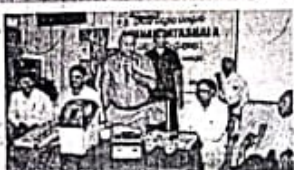
విద్యార్థులకు ఓటింగ్ విధానంపై చైతన్యంతులు కావాలి: కలెక్టర్